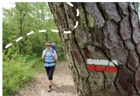
Les itinéraires de Grande Randonnée (GR®)