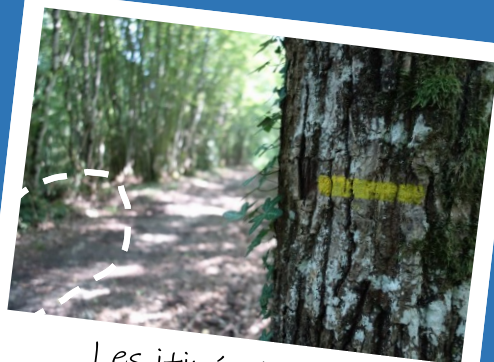
Les itinéraires de Promenade et Randonnée (PR)