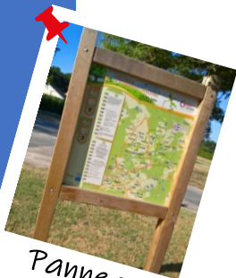
Panneau de départ

Bientôt, l'application mobile FFRandonnée : Ma Rando verra le jour pour vous accompagner partout en France dans vos randonnées. Un peu de patience, vous y retrouverez également les itinéraires du Loir-et-Cher !