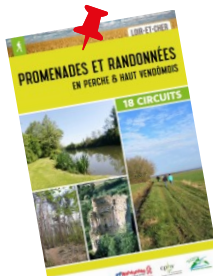
Livret de randonnée