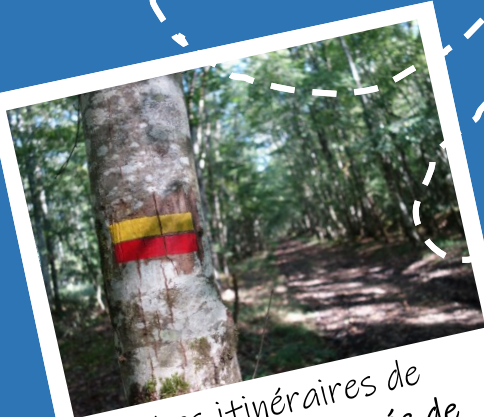
Les itinéraires de Grande Randonnée de Pays (GR® de Pays)