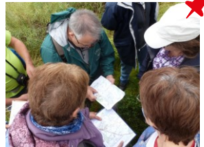
Lecture de carte

De plus, dans le cadre d'une convention de partenariat avec l'Union Départementale des Sapeurs-Pompiers du Loir-et-Cher, le Comité propose à ses licenciés et membres associés des sessions de formations PSC1 à un tarif réduit.